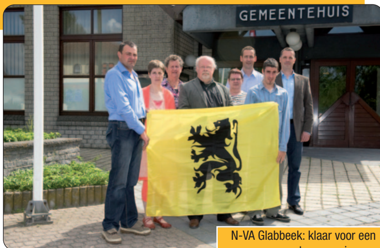
N-VA Glabbeek: klaar voor een engagement van zes jaar.

In oktober hopen wij op uw stem zodat we met de ganse ploeg de nodige verandering in Glabbeek kunnen realiseren.